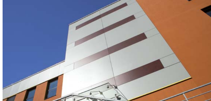
Livré en décembre 2014, soutenu par le FEDER. Constructeur : LCR

* BpiFrance Franche-Comté gère le Fonds régional d'aide à l'innovation que Région, Départements et Agglomération du Grand Besançon abondent pour soutenir toute démarche d'innovation. Contact BpiFrance Franche-Comté : 03 81 47 08 30