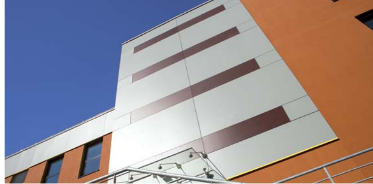
Livré en décembre 2014, soutenu par le FEDER. Constructeur : LCR

* BpiFrance Franche-Comté gère le Fonds régional d'aide à l'innovation que Région, Départements et Agglomération du Grand Besançon abondent pour soutenir toute démarche d'innovation. Contact BpiFrance Franche-Comté : 03 81 47 08 30